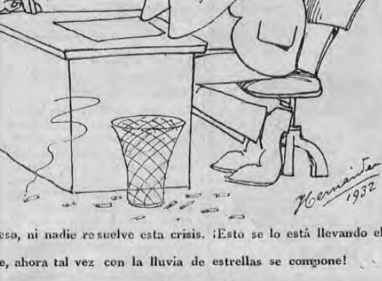
—Ni don Ricardo, ni el Congreso, ni nadie resuelve esta crisis. ¡Esto se lo está llevando el diablo! —No seas tan pesimista hombre, ahora tal vez con la lluvia de estrellas se compone!

OPTIMISMO TICO "Se anuncia para los primeros días de Noviem- bre una gran lluvia de estrellas"